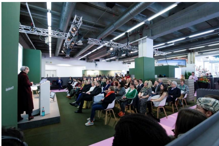
Bei Vorträgen zeigen renommierte Expert*innen auf, wie sich die Konsumgüterbranche entwickeln wird.

Digitalisierung und der Klimawandel verändern die Konsumgüterbranche nachhaltig. Um erfolgreich zu sein, erfordert es von Händler*innen mehr denn je ein Umdenken, Inspiration, Kreativität sowie konkretes, zielgerichtetes Handeln. Expert*innen unterschiedlicher Disziplinen diskutieren an allen fünf Messetagen auf den Vortragsbühnen der Halle 4.0/Saal Europa die Herausforderungen im Einzelhandel und liefern Antworten auf aktuelle Fragen. „Die Conzoom Solutions Academy ist das handelsfokussierte Vortragsprogramm für die Ambiente und die Christmasworld. Ein vielfältiges Angebot gibt dem Handel exklusive und relevante Hilfestellung für die Herausforderungen des Heute und Anleitungen für den Point of Sale von Morgen. Damit möchten wir unseren Besucher*innen einen echten Mehrwert und Wissensvorsprung verschaffen“, so Julia Uherek, Bereichsleiterin Consumer Goods Fairs.