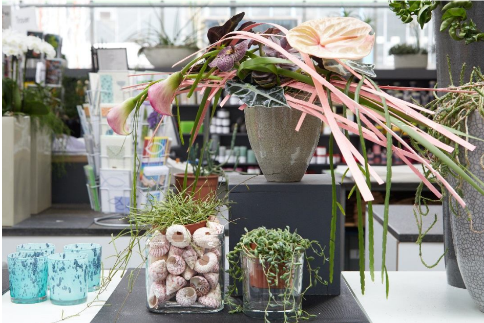
Die Floristinnen von Koch & Christmann fertigten Quersträuße und Blumentörtchen in den Trendfarben.

Das kreative Duo Thierfelder & Nawra konnte somit aus dem Vollen schöpfen, um den Christmasworld-Trend herauszuarbeiten. Zum einen konnten sie viel von dem vorhandenen Material nutzen, zum anderen auf die aktive Unterstützung des Teams Koch & Christmann bauen, das offen ihre Empfehlungen aufgriff. Da die Räumlichkeiten sehr groß und hoch sind, montierte das Experten-Duo Lampen in geometrischen sowie fließenden Formen als entsprechend großteilige Blickfänge.