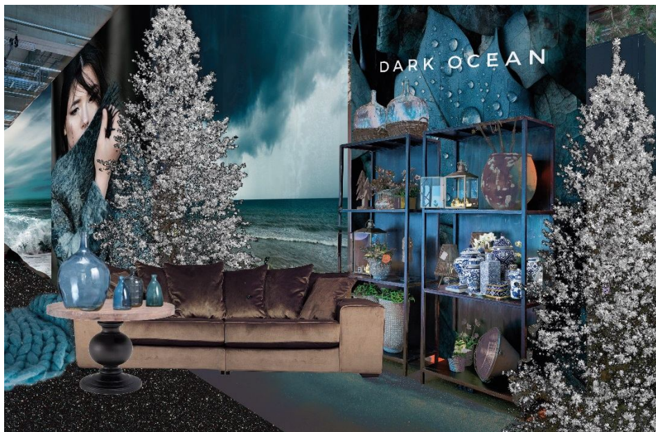
Innen begaglich und einladend: Innen erwartet die Besucher ein warmes Refugium vor dem kalten Winterwetter – inklusive Bar, Kamin und einem edlen Weihnachtslook.

Inspiziert durch die schottische Landschaft rund um das „James Bond Skyfall Castle“ (Eilean Donan Castle) kommen Meerestier-Motive wie Quallen, oxidierte Oberflächen, Treibholz und viel frisches Grün wie Seegras, blaue Orchideen, Blaubeeren, weiße Blumen zum Einsatz.