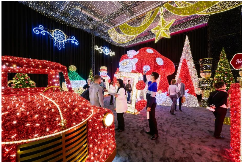
Die Produktgruppe Visuelles Merchandising & Licht in Halle 4.0 ist ein eigenes Wow-Erlebnis und garantiert Inspiration für spektakuläre Concept Dekoration.

Frankfurt am Main, Dezember 2023. Die Christmasworld bietet einen einzigartigen Produktmix rundum saisonale Dekoration und Festschmuck. Dabei ist die Messe sowie die Produktgruppe Visuelles Merchandising & Licht weltweit einmalig und bietet Inspiration für eine Inszenierung der Extraklasse für Innenstädte, Shoppingcenter und am Point of Sale – Seasonal decoration at its best.