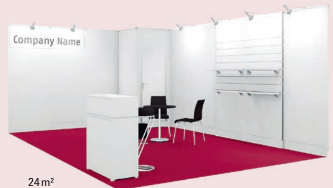
24 m 2