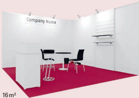
16 m 2