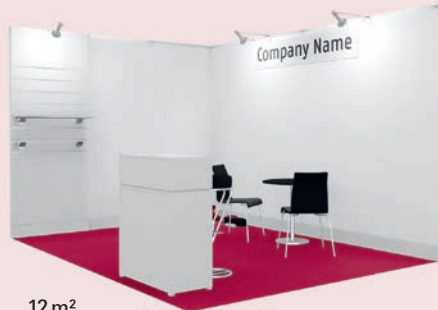
12 m 2