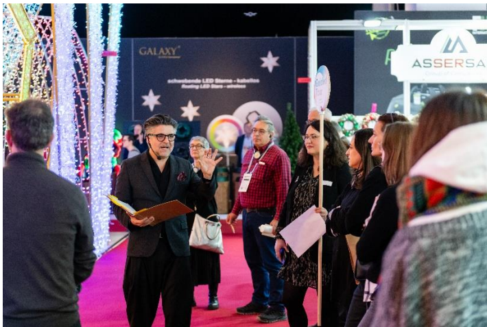
Die Guided Tour durch die Halle 4.0 ist ein Wow-Erlebnis und bietet direkten Kontakt zu Herstellern.

Frankfurt am Main, Januar 2026. Christmasworld Take Off verbindet Inspiration, Trendwissen und gezieltes Networking rund um Festbeleuchtung sowie Großflächen- und Objektdekoration. Das Event findet 2026 erstmals am Messesamstag, 09. Februar, statt und wird mit dem neuen Networking-Format Coffee & Connect erweitert – für persönlichen Austausch und wertvolle neue Kontakte in entspannter Atmosphäre.